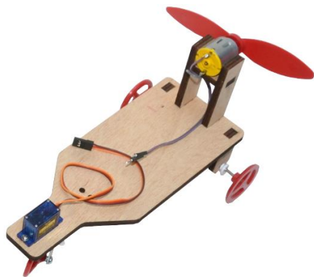
Propellerfahrzeug 555 Art-Nr. 604001